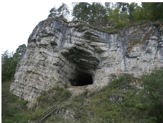
«Игнатьевская пещера» – памятник истории и культуры РФ

Здесь берут начало горные реки Юрюзань, Катав, Сим, Тюлюк, Березяк, Буланка, Лемеза, Тюльмень, Бедярыш, Куряк (бассейн реки Белой) и их многочисленные притоки.