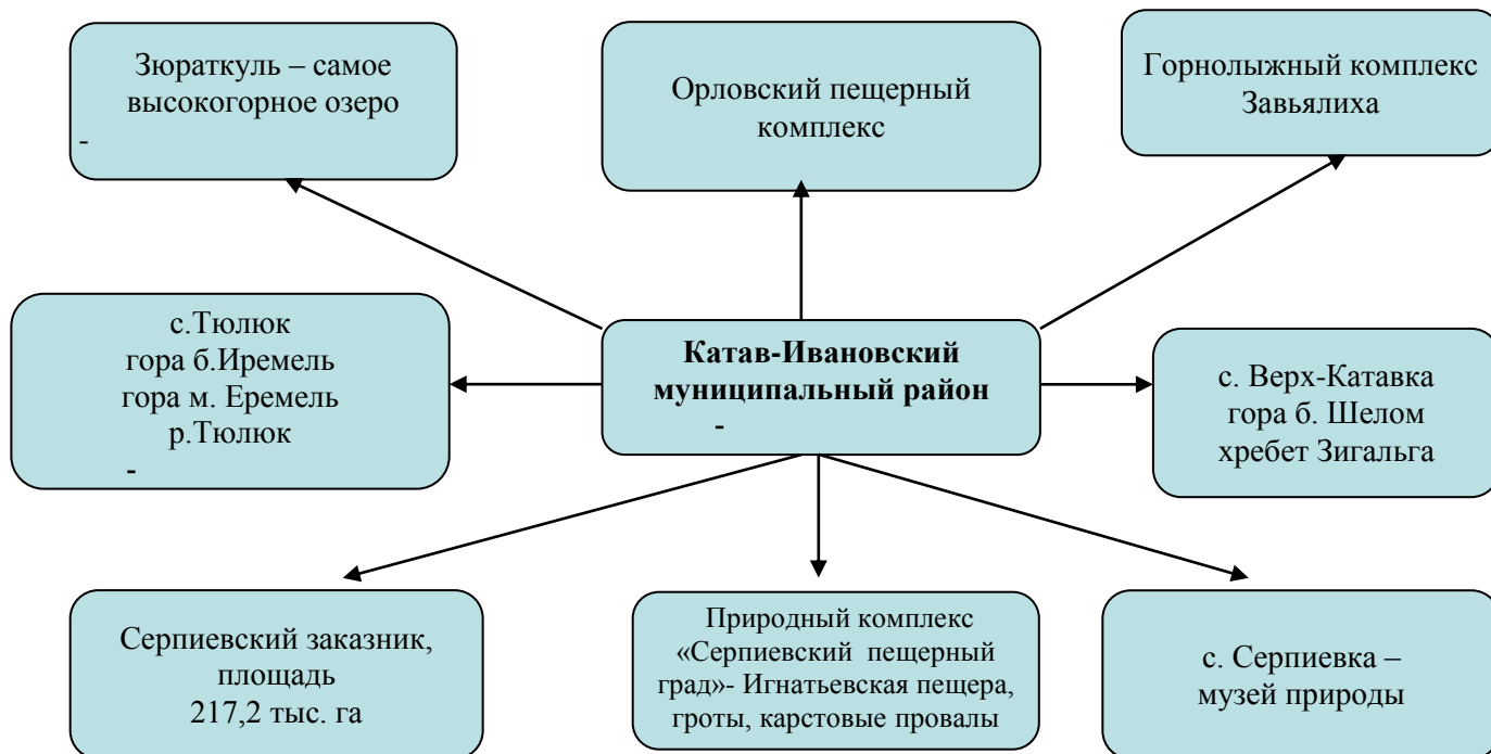
Схема туристических мест

Особую ценность представляют памятники истории и природы. Это более восьми десятков пещер, гротов, карстовых провалов, колодцев, половина из которых была обитаема с эпохи палеолита до средневековья.