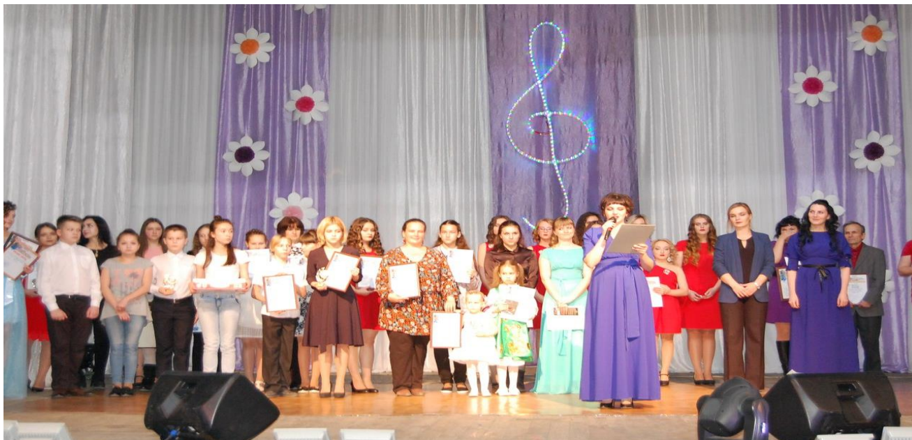
Молодые голоса 2018 год