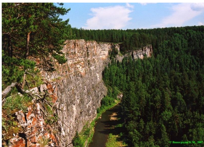
В окрестностях г. Катав-Ивановска