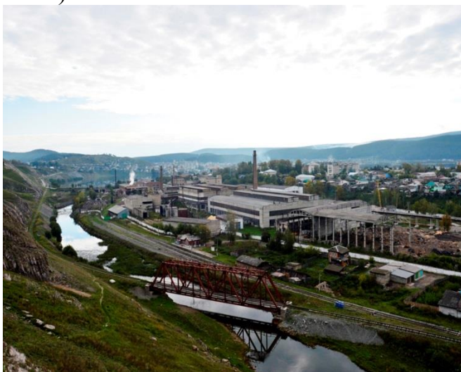
ООО «Катав-Ивановский литейный завод»

Изготавливаются любые отливки массой до 12 тонн (литьё по газифицируемым моделям, производство цилиндров мелющих: цильпёбс чугунный, художественное литьё).