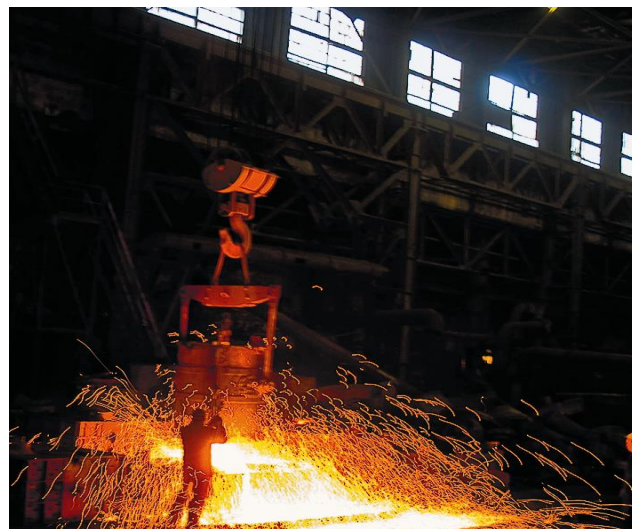
Разливка металла в цехе ООО «Катав-Ивановский литейный завод»

АО «Катав-Ивановский приборостроительный завод» – сегодня крупнейший производитель полного спектра магнитных компасов всех классов, лагов и других навигационных приборов для судов морского и речного флотов России, кораблей военно-морского флота и Пограничной охраны. Основная стратегия – расширение