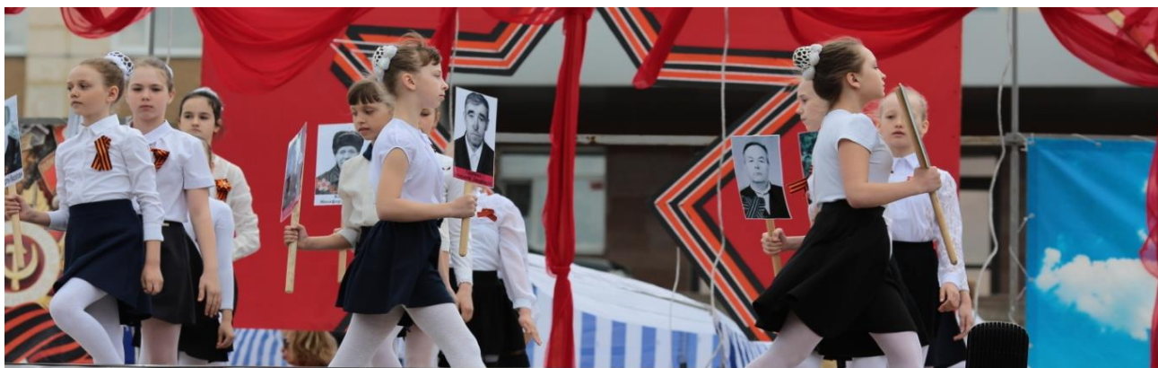
Празднование Победы в Великой Отечественной войне, 9 мая 2018 года

В 2018 году на текущий ремонт учреждений культуры было выделено 13401,02 тыс. руб. Был произведен ремонт кровли в 3 учреждениях культуры, в МКОУДО Юрюзанская ДШИ был произведен ремонт системы теплоснабжения, во многих учреждениях заменены оконные блоки. Масштабные ремонтные работы были проведены в ДК г.Юрюзань.