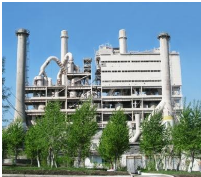
АО «Катавский цемент»

ООО «Катав-Ивановский литейный завод» изготавливает запасные части и оборудование для цементной промышленности, промстройматериалов, горнообогатительных комбинатов, черной и цветной металлургии, нефтегазовой промышленности. Основные виды продукции: запасные части к любому оборудованию из стали марки ст25-55Л, марганцовистой стали, чугуна марки сч15; дробилки четырехвалковые для дробления кокса; шаровые мельницы для керамической, лакокрасочной и стекольной промышленности; конусные инерционные дробилки для производства кубовидного щебня.