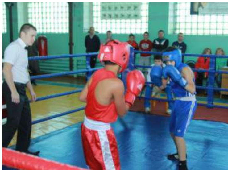
Матчевые встречи по боксу городов горнозаводской зоны сентябрь 2016 года