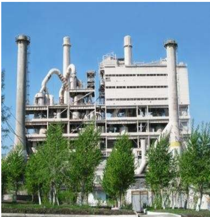
АО «Катавский цемент»

ООО «Юрюзань-Полимер» выпускает продукцию – детали декоративного интерьера кабины «Р» автомобиля «Урал».