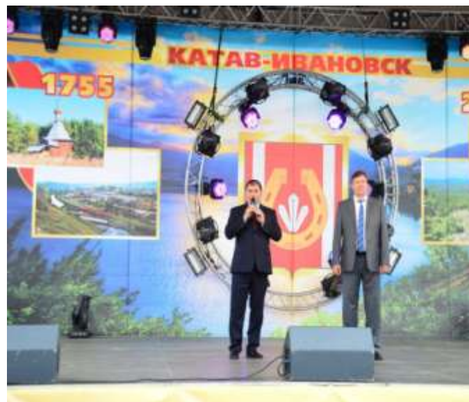
Празднование 90-летия со дня образования Катав-Ивановского муниципального района

В целях создания условий для развития местного традиционного народного художественного творчества, самодеятельного творчества в учреждениях клубного типа созданы и работают 140 формирований – это клубы по интересам, кружки, творческие мастерские, любительские объединения, вокальные и хореографические коллективы, в которых занимается 1851 человек