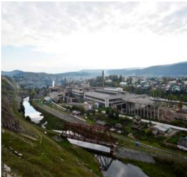
ООО «Катав-Ивановский литейный завод»

Изготавливаются любые отливки массой до 12 тонн (литьё по газифицируемым моделям, производство цилиндров мелющих: цельпечс чугунный, художественное литьё).