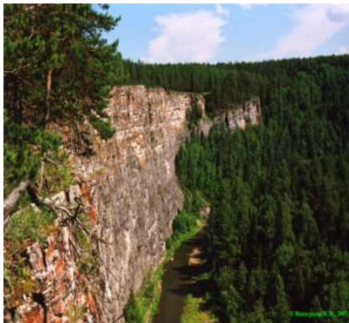
«Игнатьевская пещера» – памятник истории и культуры РФ