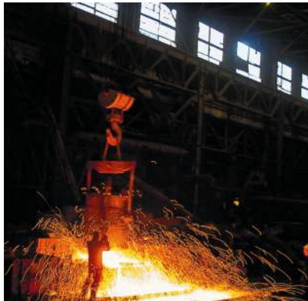
Разливка металла в цехе ООО «Катав-Ивановский литейный завод»