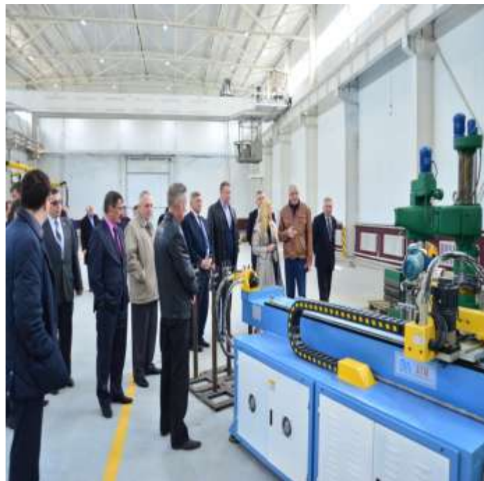
Члены Ассоциации «Горный Урал» посетили АО «Катав-Ивановский приборостроительный завод»

Определенные перспективы имеют предприятия строительных изделий (производство кирпича), использования природных ресурсов (камень «лемезит», минеральной воды). Возможности увеличения масштабов их деятельности связаны с привлечением инвестиций, расширением рынков сбыта.