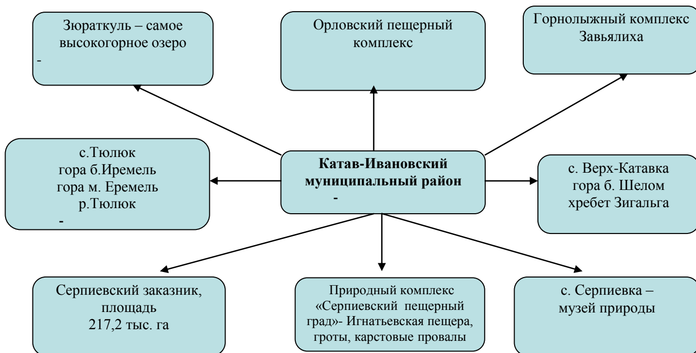
Схема туристических мест