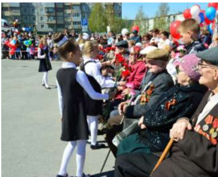
Празднование 71-летия Победы в Великой Отечественной войне, 9 мая 2016 года