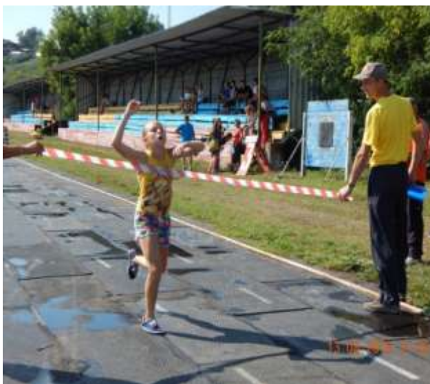
Празднование Всероссийского Дня физкультурника август 2016 года

В Катав-Ивановском муниципальном районе 59 штатных работников физической культуры и спорта. В ДЮСШ работают 25 сотрудников, из которых 12 тренеров-преподавателей на отделение бокса, дзюдо и лыжных гонок. Всего в спортивной школе занимается 431 ребенок.