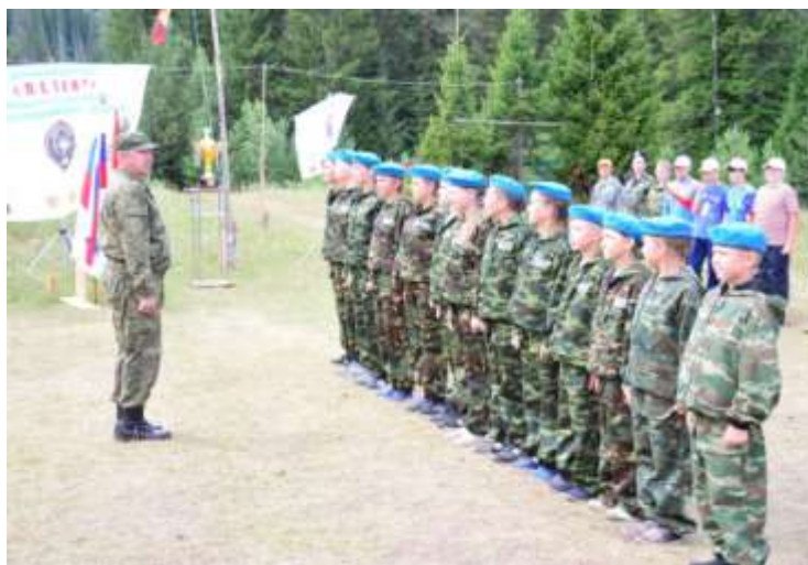
Заккрытие военно-патриотической смены областного палаточного лагеря в с. Серпиевка

В Катав-Ивановском муниципальном районе отсутствуют школы, находящиеся в аварийном, ветхом состоянии, не имеющие элементарных удобств. В 2016 году район на условиях софинансирования принял участие в мероприятиях по реконструкции и проведению ремонтных работ в образовательных учреждениях области. В частности проведен комплекс ремонтных работ в МОУ «СОШ №2 г.Юрюзань» (ремонт кровли, наружной стены, системы электроснабжения, канализации и ремонт туалетов).