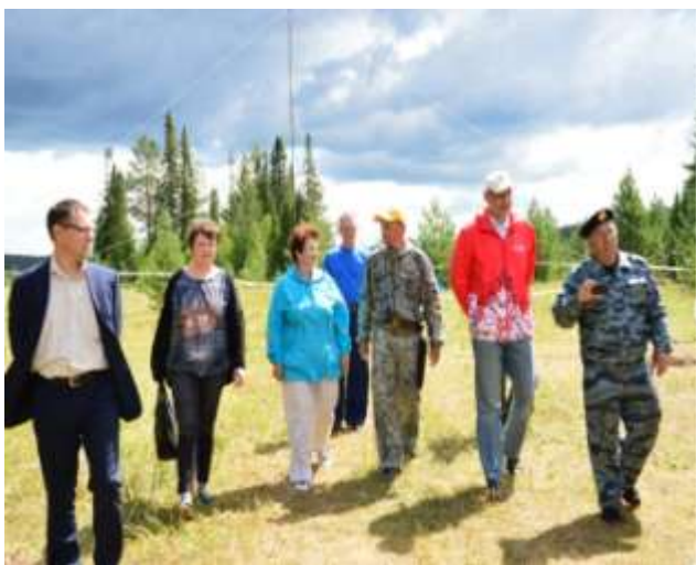
Посещение министром образования и науки Челябинской области А.И. Кузнецовым областного палаточного лагеря в с.Серпиевка

Уделяется особое внимание развитию малозатратных форм отдыха – палаточным лагерям. В период летних каникул 80 учащихся отдохнули в палаточных лагерях: Серпиевский пещерный комплекс и Миасский городской округ.