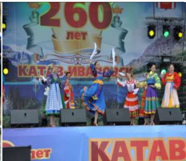
Празднование 260-летия со дня образования г. Катав-Ивановска, 4 июля 2015 года

Творческие коллективы Катав-Ивановского района приняли участие в народном конкурсе «Марафон талантов» при поддержке Губернатора и Законодательного Собрания Челябинской области. В рамках этого конкурса во Дворце культуры г. Катав-Ивановска состоялся районный конкурс народного творчества «Марафон талантов», а 5 победителей районного этапа представляли Катав-Ивановский район в полуфинале, который состоялся в г. Сатка. В финал данного конкурса из района прошел ансамбль «Родничок» ДК Орловского сельского поселения