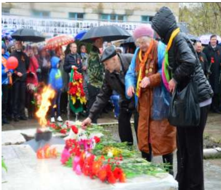
Празднование 70-летия Победы в Великой Отечественной войне, 9 мая 2015 года

Мероприятия проводились в рамках 70-летия Победы в Великой Отечественной войне, Года Литературы, 260-летия со дня образования г. Катав-Ивановска и 89-летия со дня образования Катав-Ивановского муниципального района.