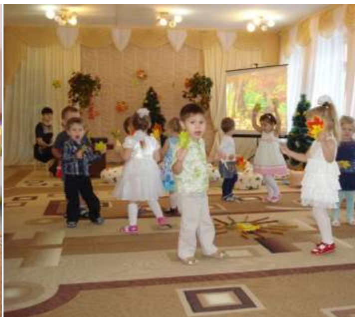
Дополнительно открытые места в детских садах

Средняя заработная плата педагогических работников дошкольных учреждений в 2015 году увеличилась на 9% и составила 20537 руб., в том числе воспитателей – 19883 руб., младших воспитателей – 10280 руб.