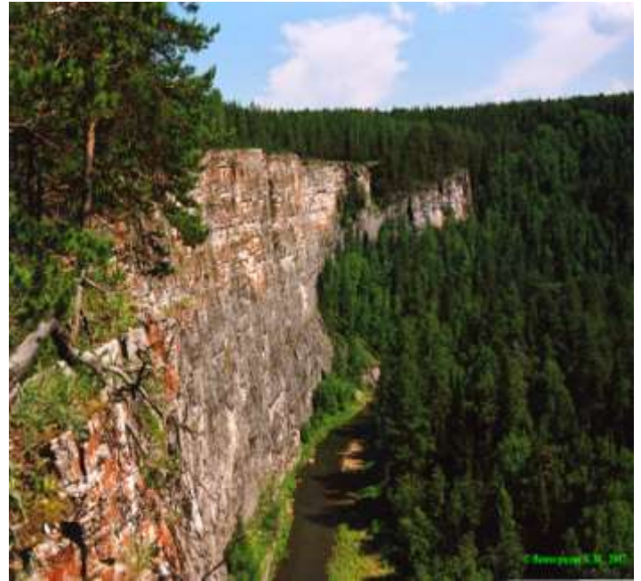
«Игнатъевская пещера» – памятник истории и культуры РФ