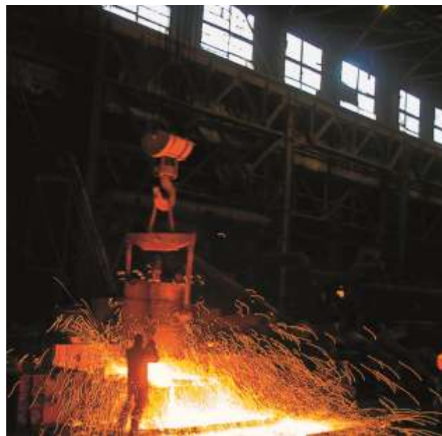
Разливка металла в цехе ООО «Катав-Ивановский литейный завод»

АО «Катав-Ивановский приборостроительный завод» – сегодня крупнейший производитель полного спектра магнитных компасов всех классов, лагов и других навигационных приборов для судов морского и речного флотов России, кораблей военно-морского флота и Пограничной охраны. Основная стратегия – расширение объемов выпуска продукции и технологическое переоснащение производства. С 2004 года разработан и начат выпуск целого ряда новых изделий. Магнитные компасы и лаги нового поколения, электромагнитные клапаны, продукция для министерства обороны и добывающей промышленности расширили рынок сбыта и диверсифицировали производство. Завод продолжает выпуск своей традиционной продукции. В производственной программе предприятия полный спектр морских магнитных компасов, предназначенных для всех видов судов, от самых крупных океанских до катеров и яхт: флагман магнитных компасов: КМ-145 в различных исполнениях (визуальные, с оптоволоконной, геометрической, электронной передачей курса); УКПМ-М в различных вариантах (на высоком и низком нактоузе, визуальные, с электронной передачей курса); КМ-90-1 – новая модель яхтенного