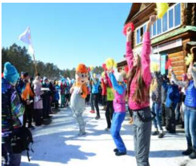
Лыжня Главы Катав-Ивановского муниципального района, март 2015 года

В Катав-Ивановском муниципальном районе 57 штатных работников физической культуры и спорта. В ДЮСШ работают 25 сотрудников, из которых 12 тренеров-преподавателей, в 2015 году в штат был принят тренер-преподаватель по дзюдо, который осуществляет работу в г. Юрюзани.