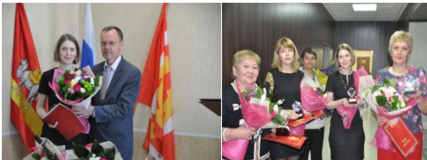
Награждение лучших представителей малого и среднего бизнеса

Представители малого бизнеса оказывают благотворительную помощь учреждениям социальной сферы, участвуют в софинансировании социально-значимых мероприятий, проводимых в районе.