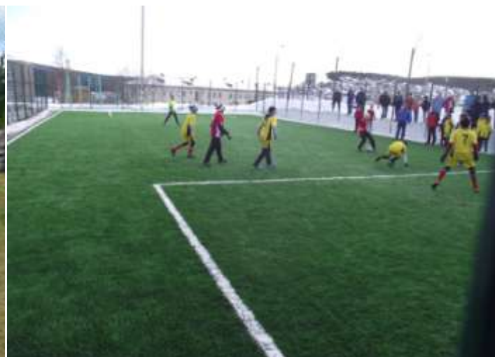
Тренировка на футбольное поле с искусственным покрытием на территории школы №1 г. Катав-Ивановска