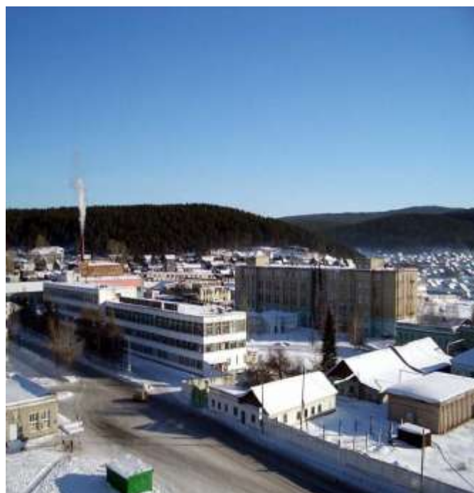
АО «Катав-Ивановский приборостроительный завод»

Определенные перспективы имеют предприятия строительных изделий (производство кирпича), использования природных ресурсов (камня «лемезит», минеральной воды). Возможности увеличения масштабов их деятельности связаны с привлечением инвестиций, расширением рынков сбыта.