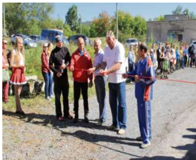
Открытие лыжероллерной трассы в г.Юрюзани, июнь 2015 года

Из 16 дошкольных образовательных учреждений района в 8 работают штатные инструкторы по физическому воспитанию. В 2015 году все дети ДОУ посещали занятия по физической культуре.