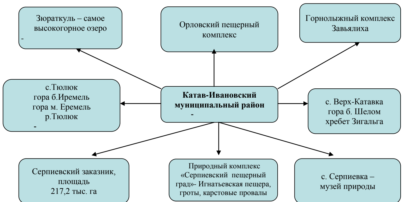
Схема туристических мест

Район привлекателен для туризма своими уникальными туристическими ресурсами. Насчитывает 11 памятников природы. Среди них памятник природного, культурного и исторического наследия «Игнатъевская пещера» эпохи палеолита, в которой обнаружено 50 групп наскальных рисунков, выполненных руками человека 14,5 тыс.лет назад. Всего на территории парка известно около 130 уникальных карстовых объектов, 12 из них были обжиты человеком.