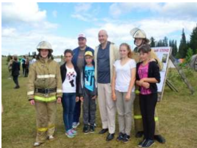
Посещение министром образования и науки Челябинской области А.И. Кузнецовым областного палаточного лагеря в с.Серпиевка

В муниципалитете накоплен позитивный опыт вовлечения школьников в олимпиадное движение, в очные и заочные интеллектуальные и творческие конкурсы.